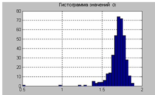
Рис. 2. Гистограмма значений \alpha