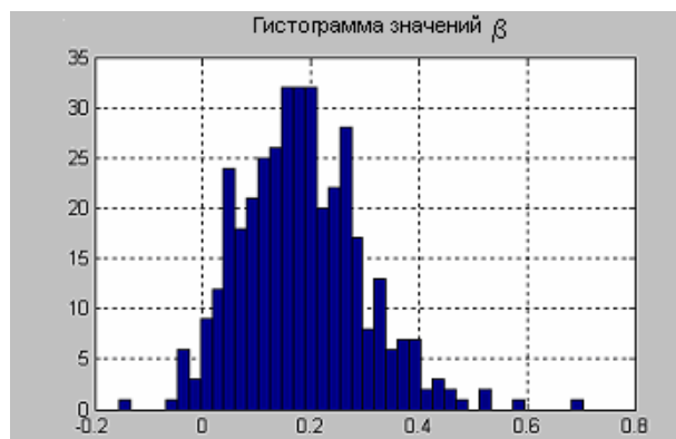
Рис. 3. Гистограмма значений \beta

Рис. 2 служит дополнительным подтверждением того, что гипотеза о нормальности распределения доходностей несостоятельна: статистические оценки параметра \alpha не принимают значения 2.