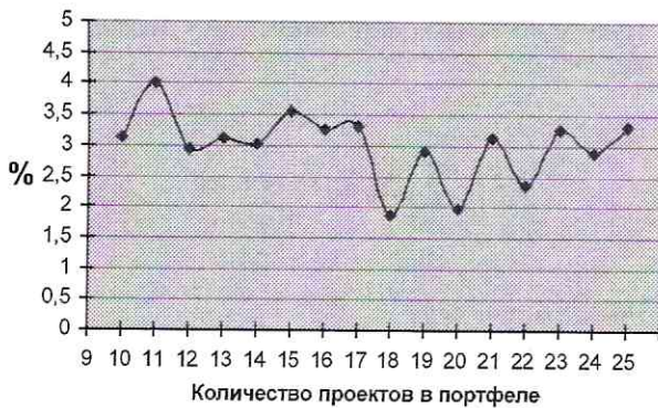
Рис. 2. Результаты проверки эффективности алгоритмов ППУ NPV и ППУ PI : \blacklozenge — максимальная относительная ошибка

Это позволяет сделать вывод об эффективности применения предложенного метода к решению поставленной задачи.