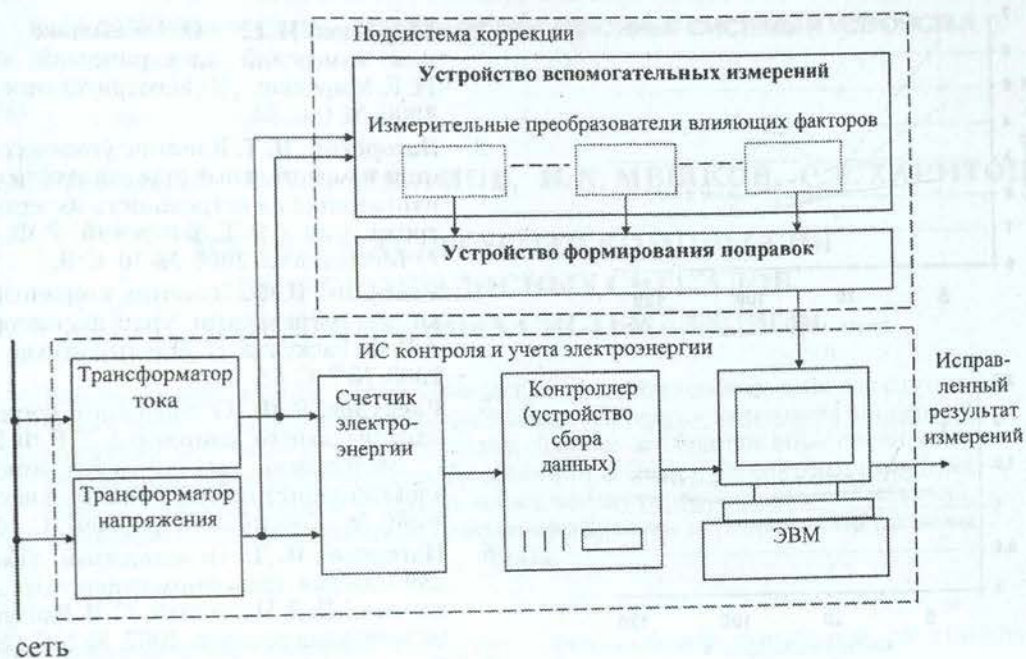
Рис. 1. Схема ИС контроля и учета электроэнергии с коррекцией погрешностей

Для реализации ИС, согласно ГОСТ 8.217-2003 и ГОСТ 8.216-88 на базе передвижной лаборатории для поверки трансформаторов ФГУ «Центр стандартизации, метрологии и сертификации Республики Башкортостан» были проведены экспериментальные исследования зависимостей погрешностей ИТ от факторов, оказывающих наибольшее влияние на их характеристики [4, 5]. Разработанная математическая модель влияния дестабилизирующих факторов на погрешности ИТ включает в себя дополнительные погрешности, не регламентированные в технической документации и зависящие от внешних воздействий.