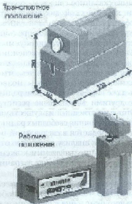
Рис. 1. Внешний вид прибора

специалистов, работающих в различных областях, объясняются рядом причин.