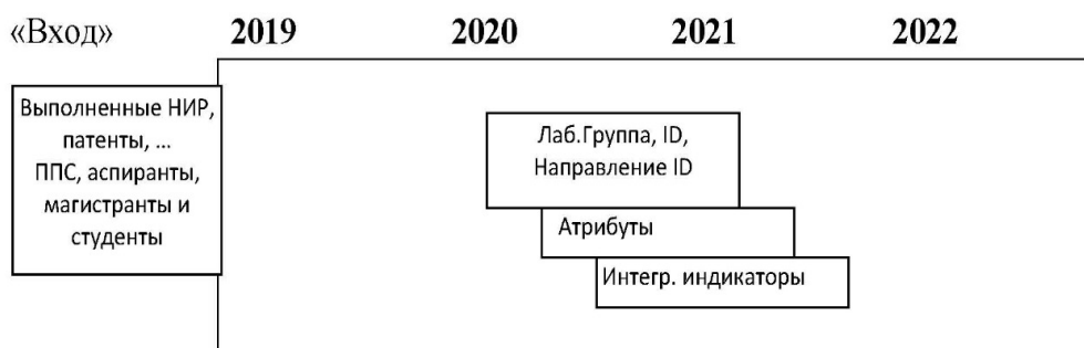
Рис. 4. Множество интеллектуальных агентов «ЛАБ-группа»- междисциплинарные проектные команды. По годам, с привязкой к ID «студент-группа» и к ID «ППС-группа»

Предлагаемые выше типы интеллектуальных агентов представляют собой групповой тип. Формально группа не является единым организмом, объединение агентов соответствует достижению требуемых целей всей системы. Назначение агента-студента [15] – отражать потребности и возможности каждого конкретного обучаемого в приобретении знаний, информировать о них систему. Назначение агента-преподавателя доставлять подобранный контент и сценарий обучения студенту.