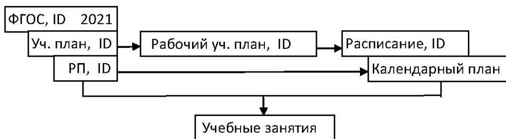
Рис. 1. Модель процесса обучения

Однако процесс образования, в отличие от производственного, имеет ряд специфических особенностей. Это процесс длительного цикла, для которого характерны: