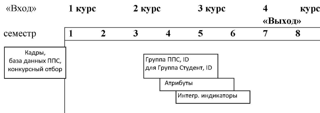
Рис. 3. Множество интеллектуальных агентов «ППС-группа». Все специальности и направления подготовки, по годам, с привязкой к ID «студент-группа» и к хронологии событий