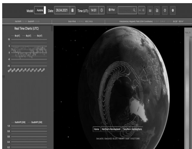
Рис. 2. Пользовательский интерфейс Aurora-forecast

Финальной частью визуализации стало формирование пользовательского интерфейса так, чтобы веб-сервис при достаточно богатом функционале, не потерял в информативности (Рис. 2)